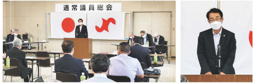
令和3年度 収支決算 (90,050千円)

令和3年度は、コロナ禍の中、会員の皆様の信頼に応えるべく、行政など関係機関との連携を図りながら、各種事業を積極的に推進してまいりました。当所は、これからも地域経済の活性化に寄与できるよう役員一同、一層努めて参りますので、会員の皆様の更なるご支援、ご協力をお願いします。