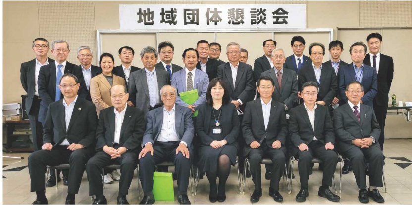
令和4年度 地域団体懇談会 出席者名簿